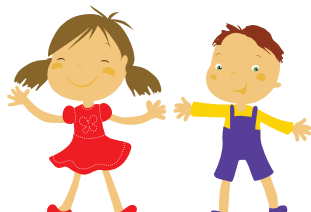
siostra i brat – sister and brother