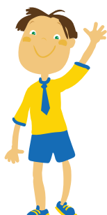
tata – father