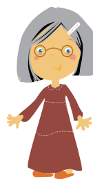
babcia – grandmother