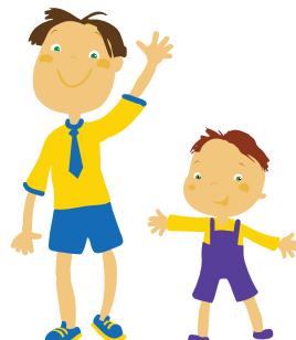
tata i syn – father and son